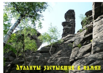
АТЛАНТЫ ЗАСТЫВШИЕ В КАМНЕ

Высокие башни-братья, словно стражи, охраняют покой Урала. В ходе экскурсии Вы узнаете множество легенд об Урале, и разнообразных преданий об этих скалах, о народах, которые населяли эти земли издревле. Это место издревле считалось сакральным. Вы сможете сделать уникальные фотографии первозданной природы языческого Урала!